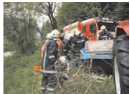
Gemeinschaftsübung FF Schwendt