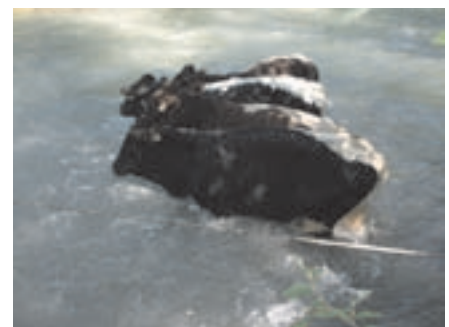
Technischer Einsatz 17.05.09