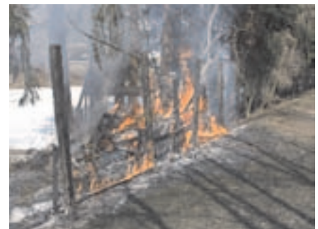
Brand Gasteiger Straße