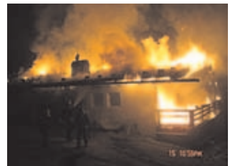
Brand Steinerberg 15.04.09