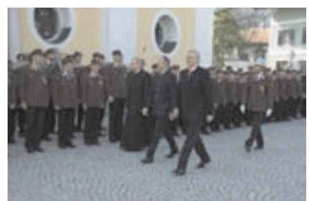
Florianikirchgang mit Fahnenweihe