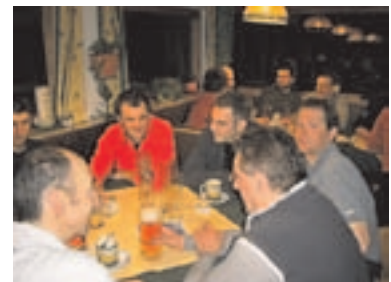
Ski Tour Stanglalm