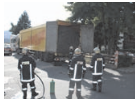
Technischer Einsatz 13.06.09