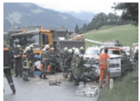
Verkehrsunfall Huber Höhe 10.07.09